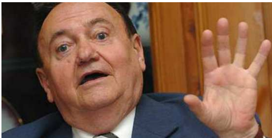
Torgyán József bekerítve?

Bár Boros Imre ideiglenes miniszter példátlan gyorsasággal névre szóló feljelentést tett ellenem, tényállást (?) adott és megrendelte (még az eljárás kezdete előtt!) elítélésemet, napról napra lejárató és hazug cikkek jelentek meg rólam, hetekig semmi érdemi nem történt, nem mozdultak meg azok a bizonyos fogaskerekek . (Annak ellenére, hogy voltak, akik ezen rajta voltak.) Torgyán Józsefet kizárták a frakcióból, felszólították, hogy mondjon le pártelnöki tisztéről vagy vigye pártelnökségét a nagyválasztmány elé. Boros feljelentése március 7-én történt, de két hónapig, május elejéig állt az eljárás. A névre szóló feljelentést átminősítették ismeretlen tettes ellenire és vártak. Feltehetőleg arra gondoltak, hogy Torgyánt eltávolítva „alkalmas” személyt találnak a Kisgazdapárt vezetésére. Torgyán egy ideig kitért újraválasztása elől, majd mégis kitűzte a fórumot. Április 18-án viszont – megneszelve, hogy megbuktatását készítik elő – más helyszínre, Nyíregyháza helyett Ceglédre tette át a helyszínt. Itt jobban kézben tudta tartani az eseményt, bár ez sem volt egyszerű: mindenféle szervezetek vettek részt – meghívó nélkül – az eseményen.