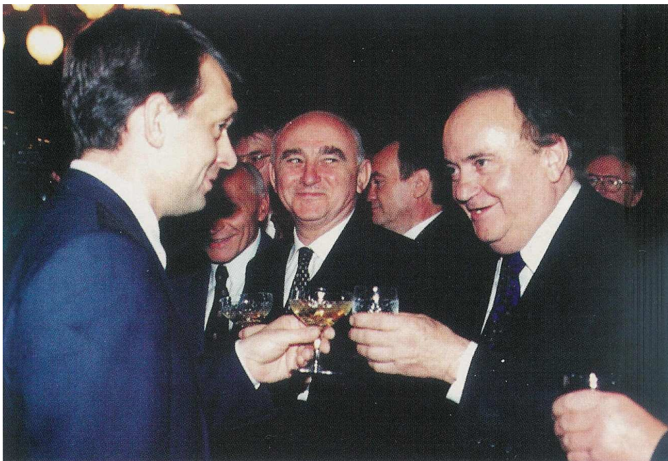
Az első Orbán-kormányban jobban ment

Magyarország a válságban, a leépülésben, a kormány teljesítményében valószínűleg a leggyengébb helyzetű országok sorában van. Az EU-ba újonnan csatlakozott országok között mindenképpen a legrosszabb a helyzete. Éppen itt vannak olyan országok, amelyek feltalálták magukat. Lengyelország pl. akkor is tudta növelni termelését, amikor a világon szinte mindenütt csökkent.