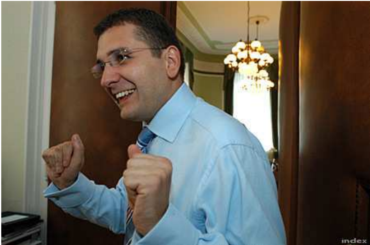
Kóka János orvos, gazdasági miniszter: dübörög a gazdaság, száguld a puma!

Kóka János idejéhez alaptalan legenda kötődik, mintha roppant gyorsan nőtt volna a gazdaság. Ezt ideje egyszer és mindenkorra megcáfolni. Az kétségtelen, hogy Kóka János gazdasági miniszterként 2004 és 2008 között a magyar gazdaságot Pannon Pumaként jellemezte. Egy időben heti rendszerességgel mondta el: dübörög a gazdaság! Ha ezt a kiemelkedő ütemre értette volna, nagyon túlzott. 2004-ben, 2005-ben és 2006-ban ugyan 4 százalék körüli ütemek voltak, de ettől aligha dübörgött a gazdaság és száguldott a Pannon Puma. (A puma különben sem szokott száguldani, inkább a fán üldögél.) 2007-ben stagnált a gazdaság, a puma tehát üldögélt, 2008-ban viszont egy százalék alatt teljesített, tehát szintén üldögélt. Egy másik félreértés (félremagyarítás): azt állítják, hogy a lakossági devizahitelezésre a különösen magas gazdasági növekedés érdekében volt szükség. Ideje megkérdezni a volt miniszterektől, akik ezt állítják: tessék mondani, hol van itt a nagy dinamika?