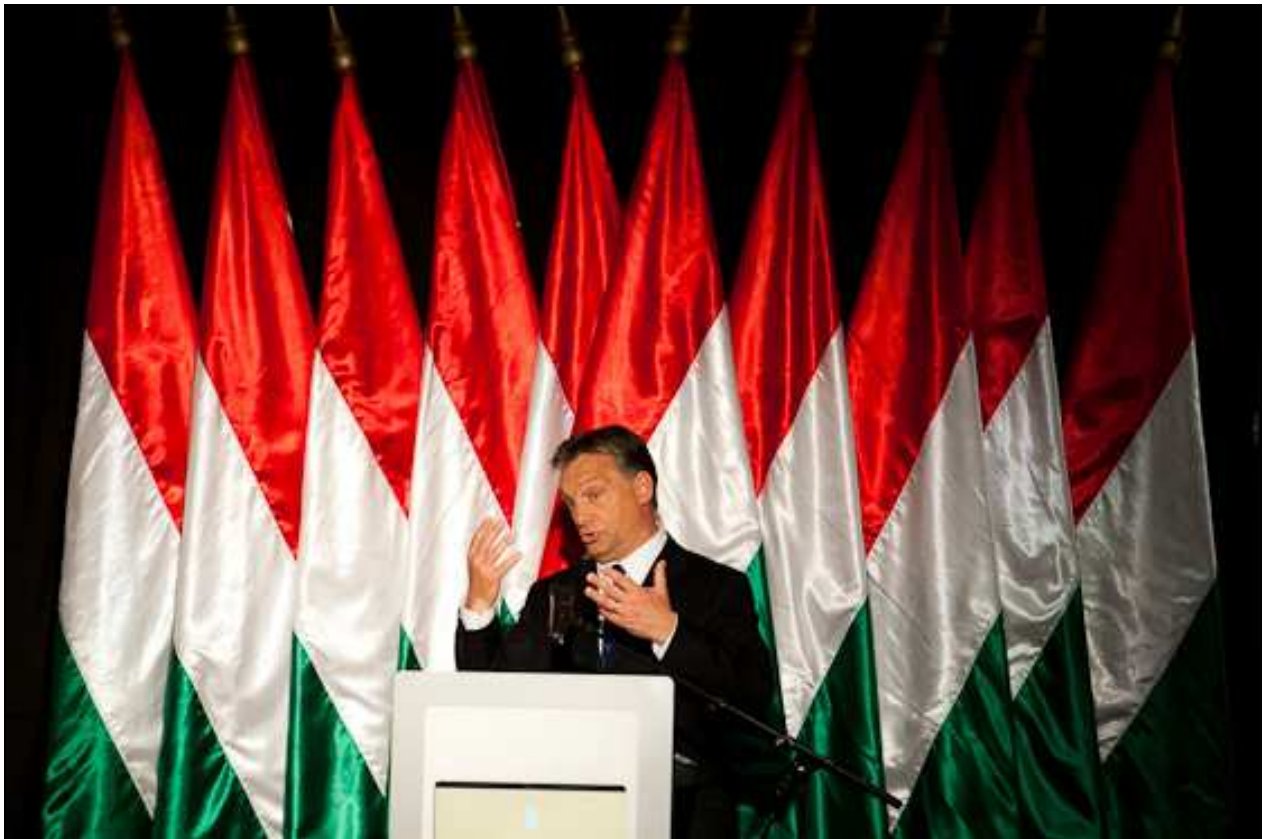
Orbán Viktor az Új Széchenyi Tervről

A pénzügy és a közgazdaság elkülönítése céljából javasoltunk annak idején két külön minisztériumot. Ma egy van helyettük, a pénzügy megszűnt, a nemzetgazdaságit viszont pénzügyes módra vezetik.