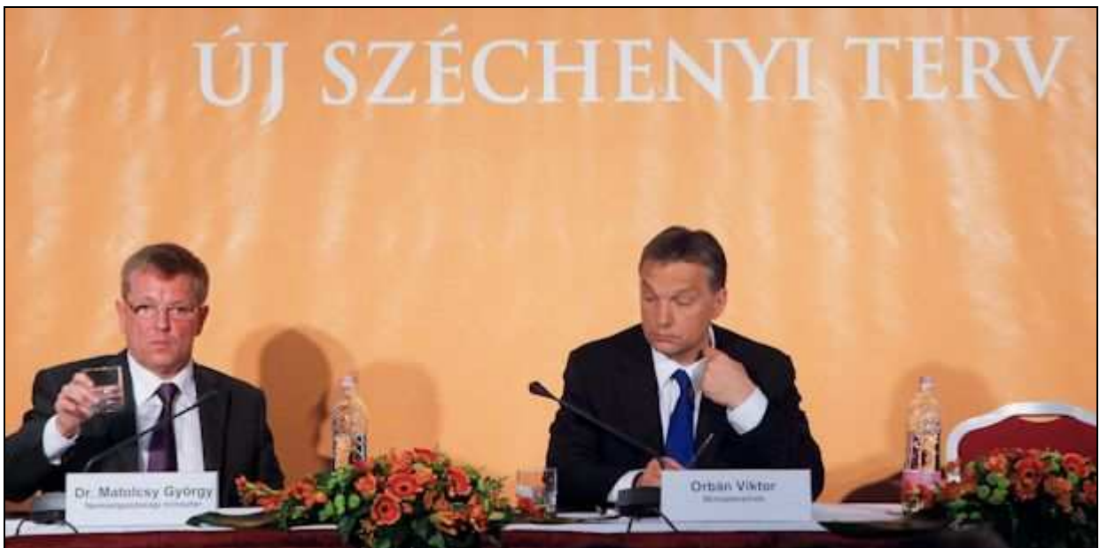
Orbán Viktor és Matolcsy György

Nem lehet csodálkozni tehát azon, hogy senki sem szívesen mászik bele ebbe a „masszába”, még ha lenne is e téren muníciója. Én azonban ezt már elkezdtem, amikor néhány hónapja megjelent könyvemben ( Kényszerpályák, tévutak – Az új nomenklatúra ) a Széchenyi Tervről is írtam (az elsőről), mint az egyik lehetséges tévútról, egyben álszervizűről. Túlzó elnevezéséről (Széchenyi felismeréseihez való hasonlításáról), leszűkölt hatóköréről (az érintett területeket sem mind hangolja össze) és a pénzosztás praktikumának való alárendeléséről. Ebből következőleg az első Széchenyi Terv feltehetőleg nem a legkedvezőbb hatékonysággal biztosította a célok elérését. A probléma hasonló, mint az autópálya-építésnél: jó, hogy épültek autópályák, de nem mindegy, mennyiért. Más hatókörű és személetes megvalósítás nyilván jobb eredményt hozhatott volna. Úgy láttam és látom, hogy hiba és pazarlás lenne, ha minden ott folytatódna e tervvel, ahol abbamaradt.